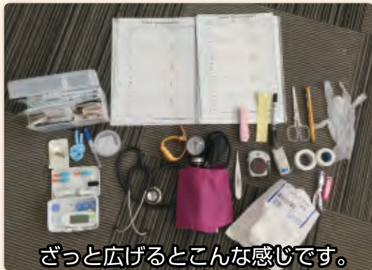
ざっと広げるとこんな感じです。