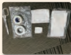
傷に使うガーゼとテープ