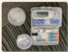
血糖値を測る機械